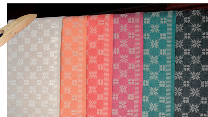
Løpere i flere farger

Det svever skaperglede, engasjement og optimisme i lufta: