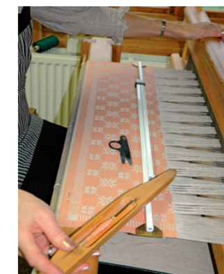
Veving er spennende