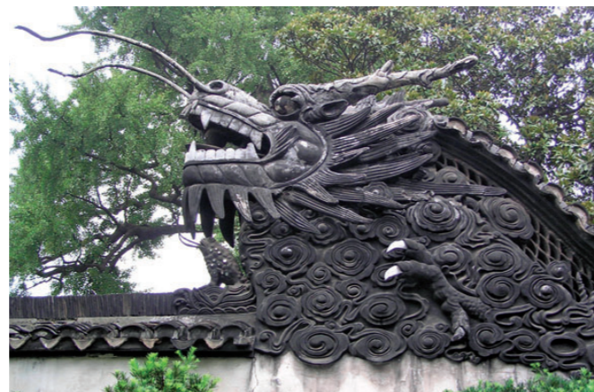
Fra Yu Yuan Gardens i Shanghai