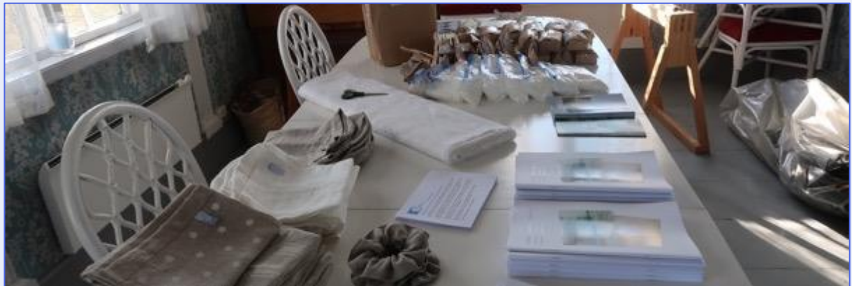
Salg av såpespon, linfrø, spinnelin og brødposer

Så var det stor lunsjbuffet og deretter åpent for marked med demonstrasjon av arbeid med lin og salg av foreningens linprodukter. Fargegruppa hadde også en utstilling av farget garn og vevinger. Frø, såpespon, spinnelin og brødposer gikk unna – kasserer Gerd var fornøyd med resultatet av salget.