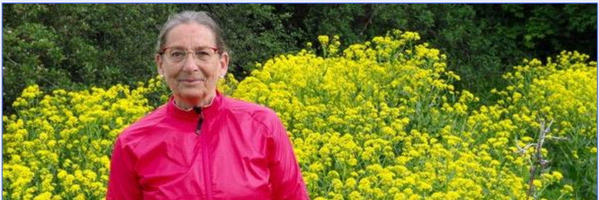
Waid langs landeveien

Etter hvert ble dog avlingene mindre, tredveårskrigen (1616 – 1648) gjorde det vanskelig å få til samarbeid om vekselbruk og to-treårig syklus og til slutt kom den billige, importerte indigo fra de amerikanske koloniene. Og med den syntetiske indigo som kom på markedet i 1897, forsvant også den naturlige indigo.