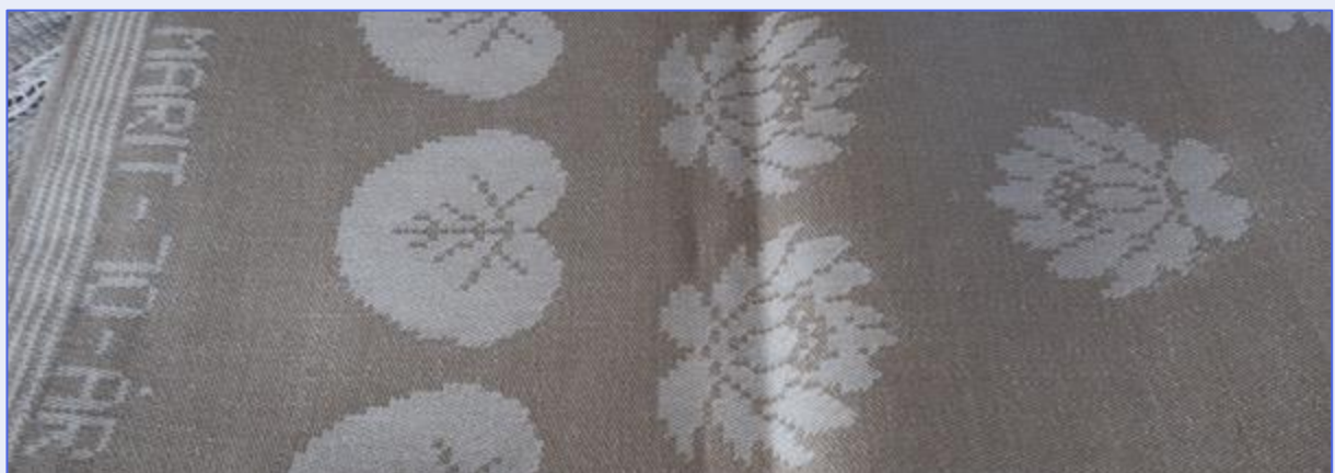
Damaskvevet duk fra Skogn