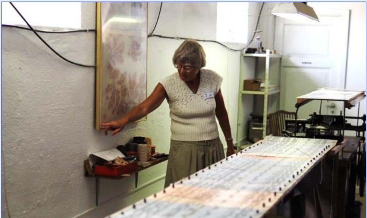
Det er mye arbeid med vedlikehold av hullkortene