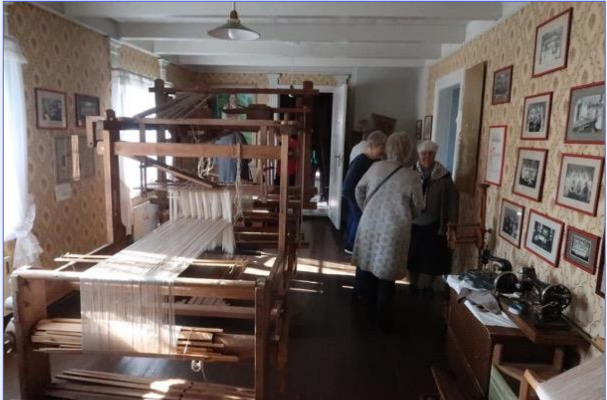
Damaskvevstolen som er under montering på Brusve Gård

En av disse vevene fra Skogn ble funnet på Munkeby kloster og den er nå under montering på Brusve Gård. Vi fikk en orientering om dette arbeidet, selve veven og også om en del arbeider fra omegnen som var utstilt i 2. etasje på gården