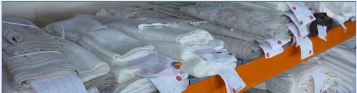
Lagerhylle fra Thomas Ferguson Linen Factory utenfor Belfast

"He went to Hell, but his wife got well And is still alive and sinning. For the razor blade was Dublin made But the sheet was Belfast linen. "