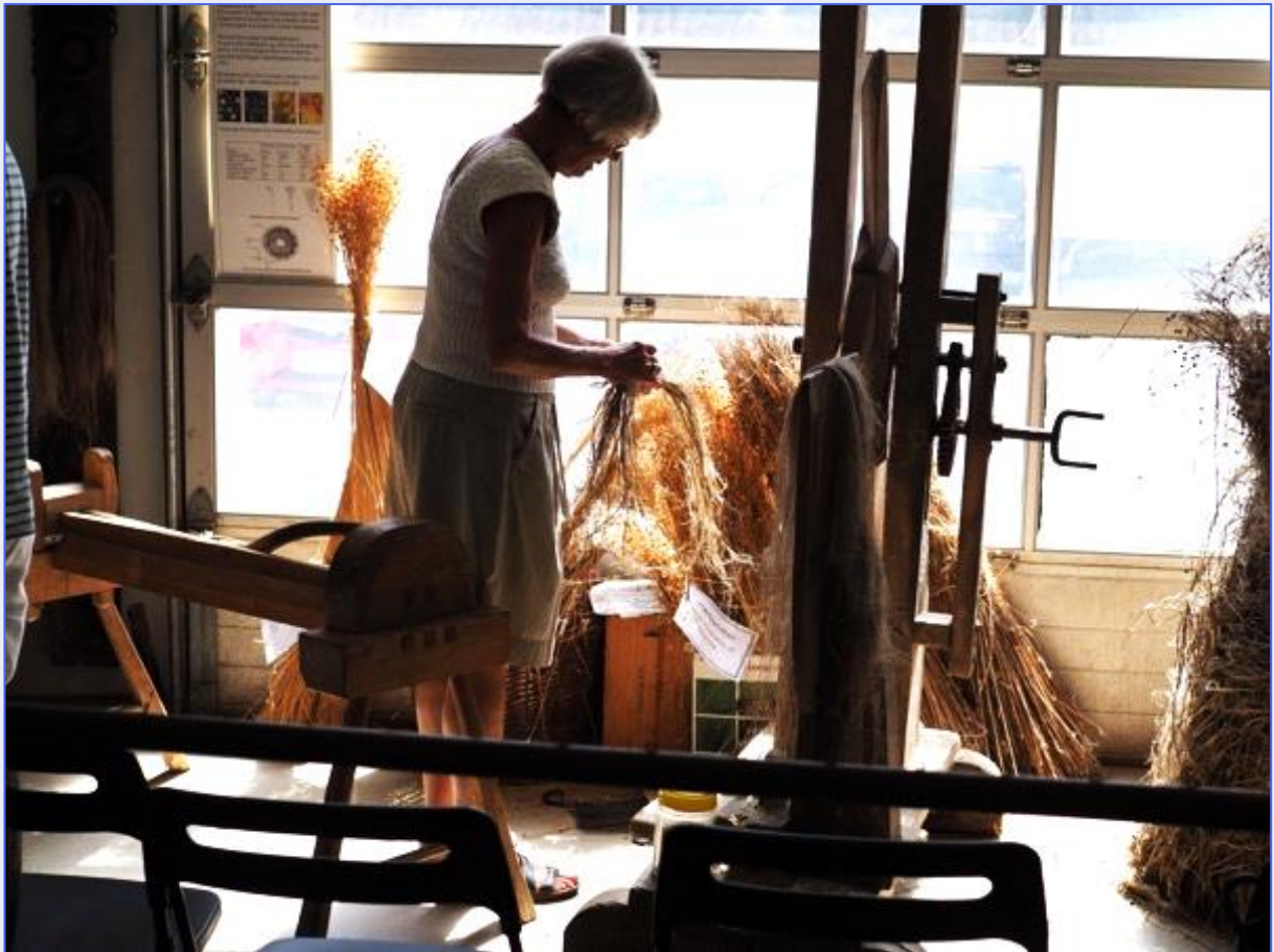
Demonstrasjon, beredning av lin