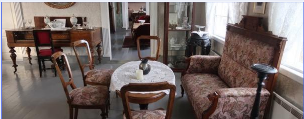
Fra Brusve gård