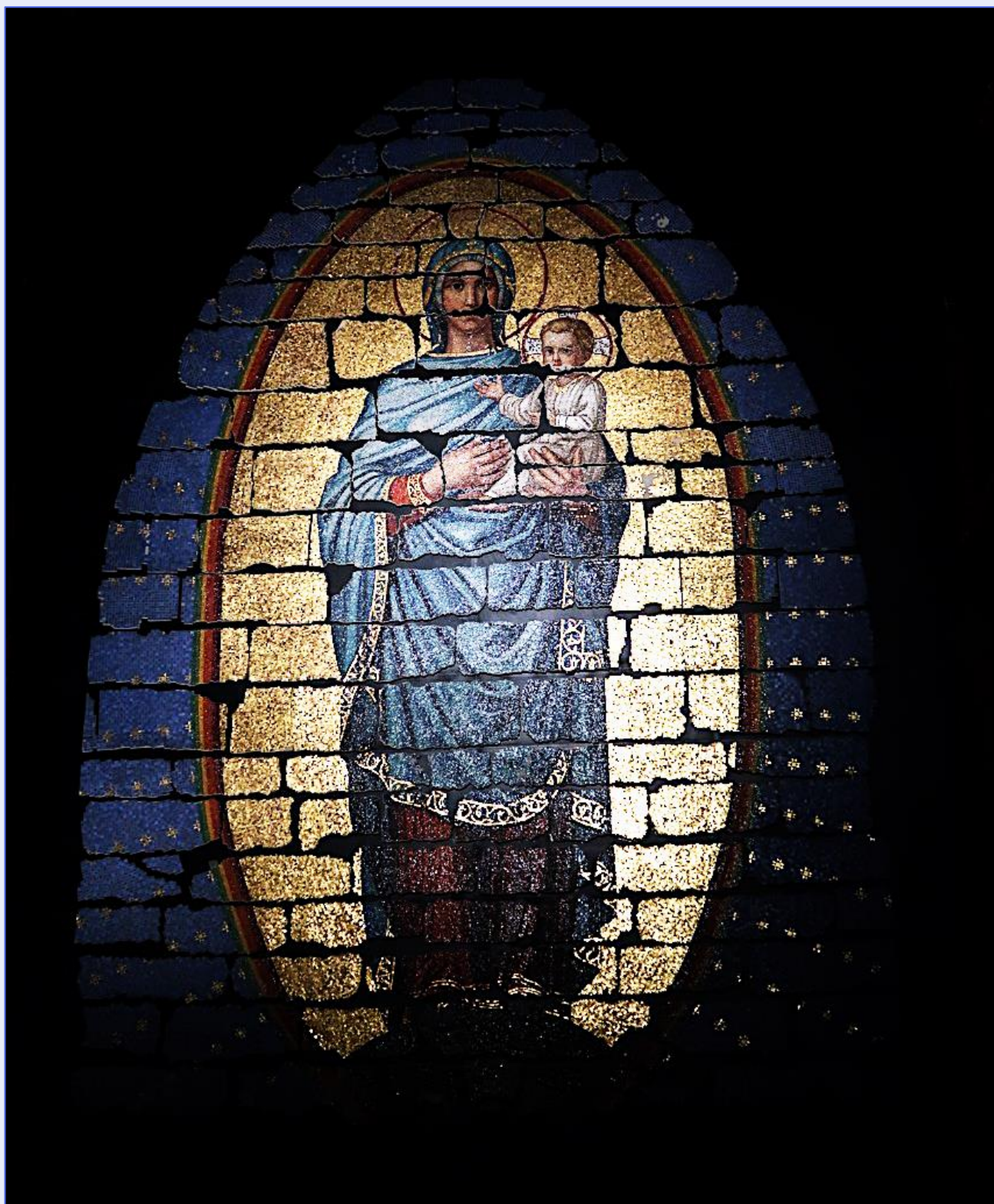
Den restaurerte Mariamosaiken under taket på domkirken ( 8x6 meter )