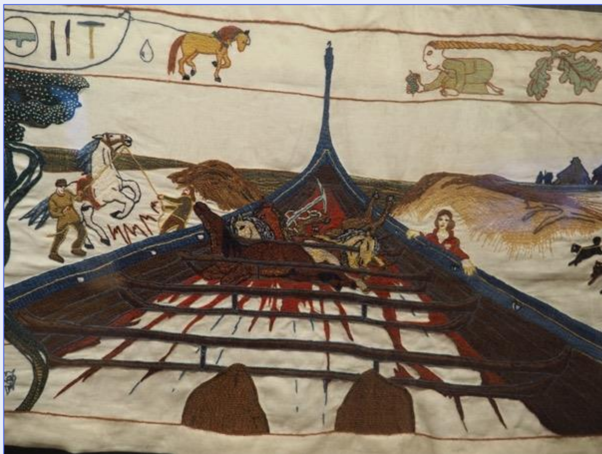
Motivet her er det blodige dramaet når 11 hester ble tatt ombord i Ladbyskipet og slaktet.

Lokale planter og plantedeler er brukt til fargingen og i hovedsak er det de samme 7 fargene som er brukt i Bayeuxteppet. Broderteknikken er Bayeuxsting, dvs. dobbelt nedlagt syning, kontursting, franske knuter etc.